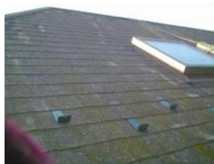
コケがびっしり蓄積している