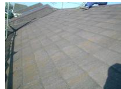
風化して、はげかかっている