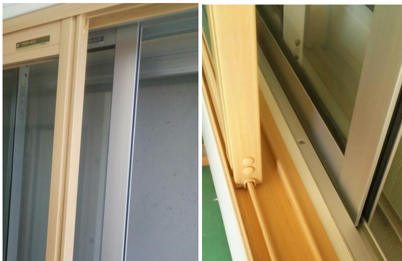
手前：プラマードU 奥：今までの窓