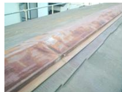
棟押さえトタンのサビ