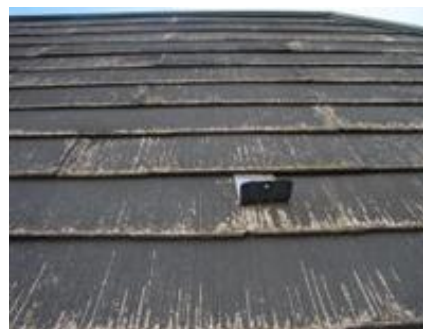
反り返しのため隙間が生じる